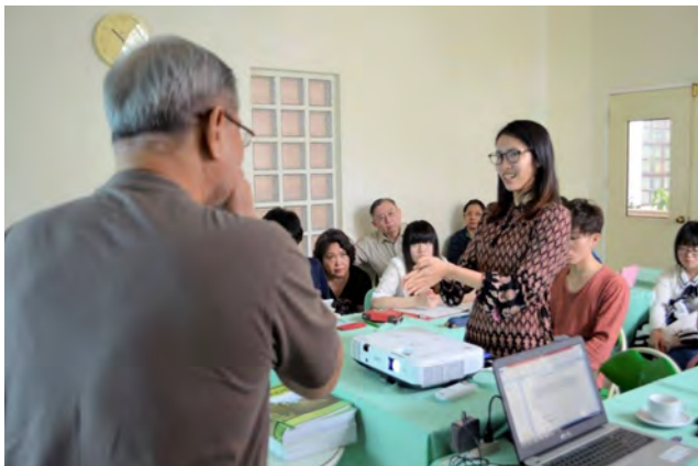
横浜国立大学フィールドワーク