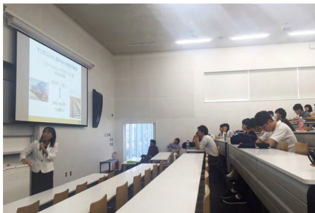
池田ADBエコノミストによる講演