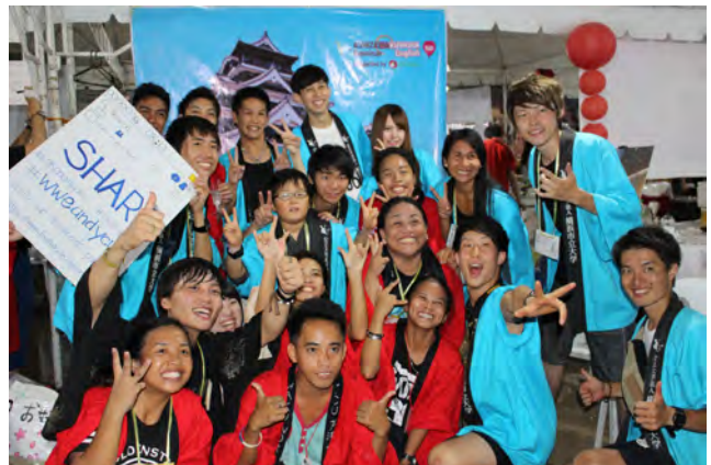
横浜市立大学フィールドワーク