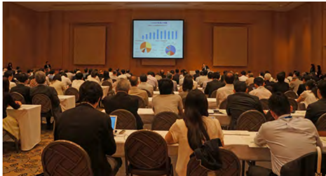
講演中の会場の様子