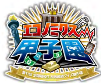
エコノミクス甲子園ロゴ

今回、第50回アジア開発銀行(ADB)年次総会の横浜開催を記念し、ADB駐日代表による特別講演やADBに関連するオリジナルクイズの実施において、横浜市が協力しました。