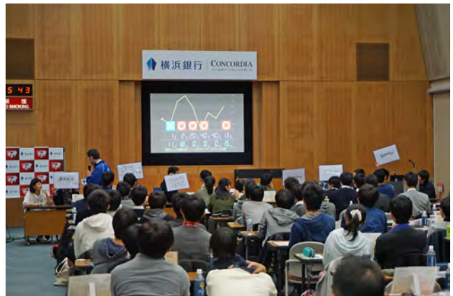
クイズ選手権の様子