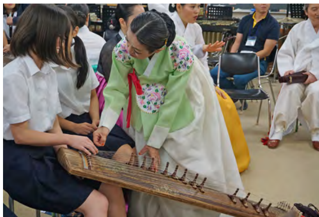
韓国光州広域市芸術団