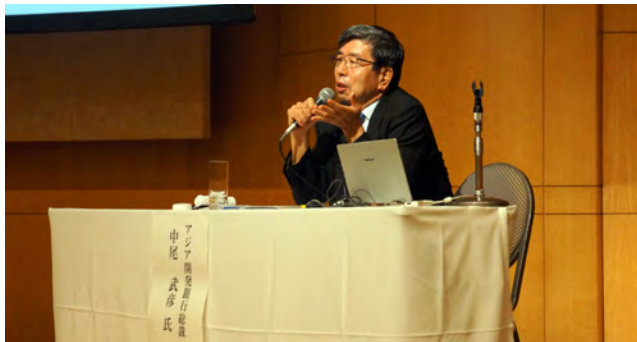
講演する中尾ADB総裁