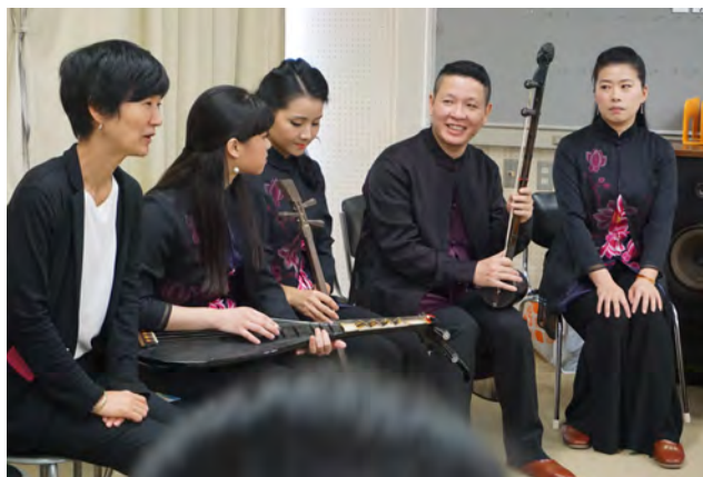
中国泉州市芸術団

泉州市 14人(関係者1人、泉州市南音楽団13人) 光州広域市 15人(関係者5人、風流会「竹禪房」10人) 高校生 70人